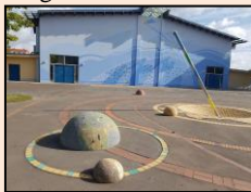
Reuterstädter Schulcampus (Schulhof Haus 1)

Für Ihre Fragen steht Ihnen die Schulleitung per E-Mail, per Fax, telefonisch oder zu Vor-Ort-Gesprächen gerne zur Verfügung.